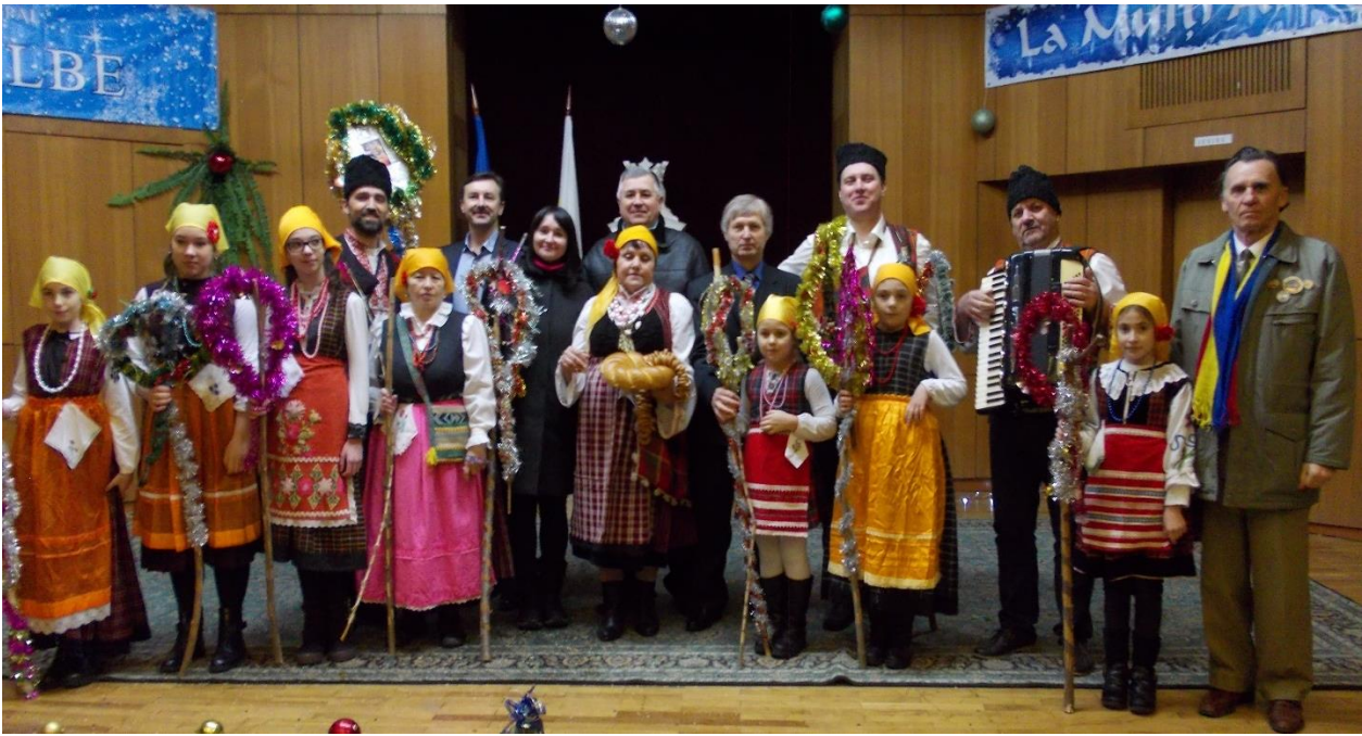
Фестивал «La Onor, la Datorie!»