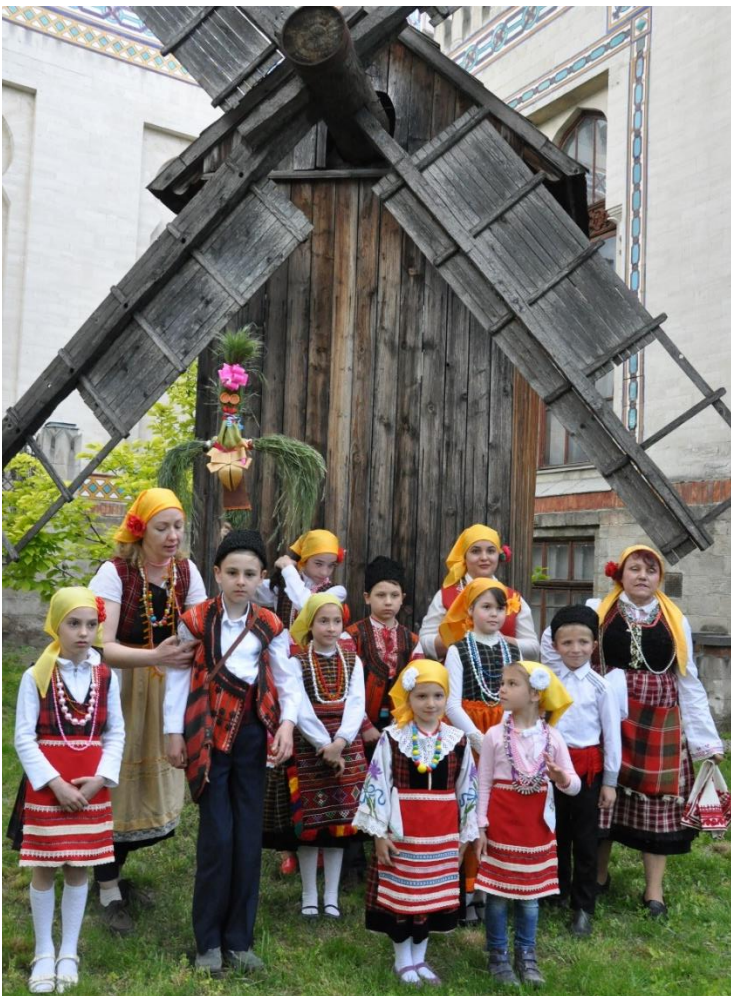
Етнофолклорен ансамбъл на екскурзия в Национален Музей по Етнография и Природна История