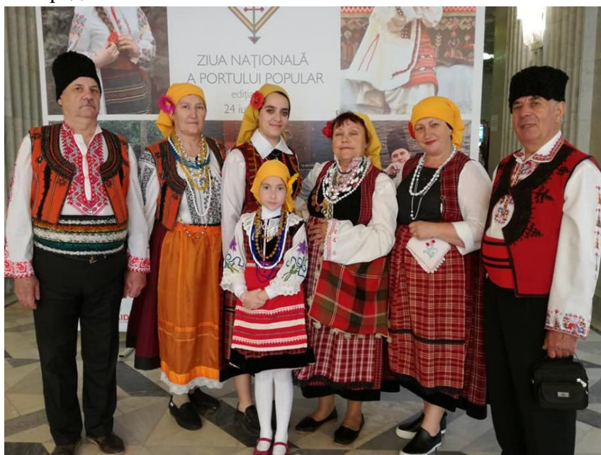
Част от членовете на „Въгленче“