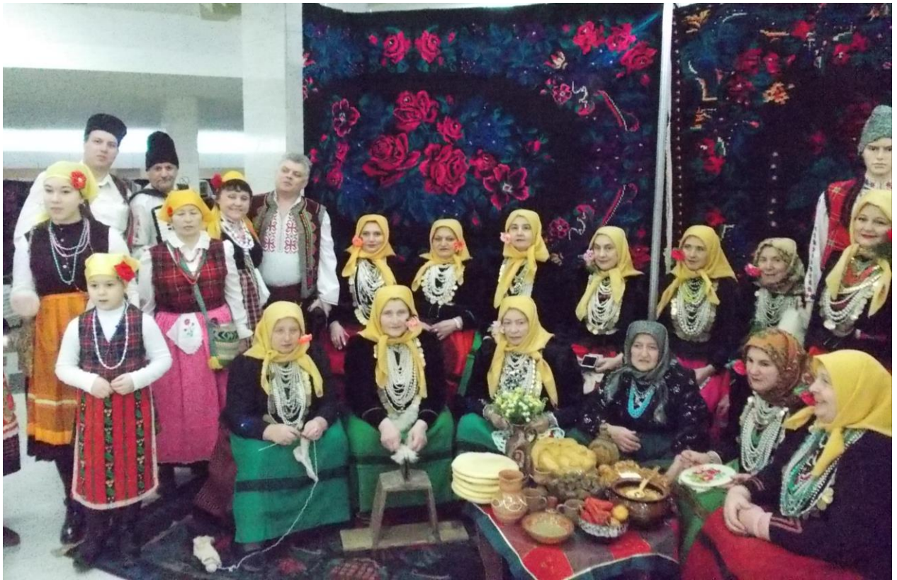
Фестивал на килимите. «Въгленчето» с артистите от г.Твърдица.