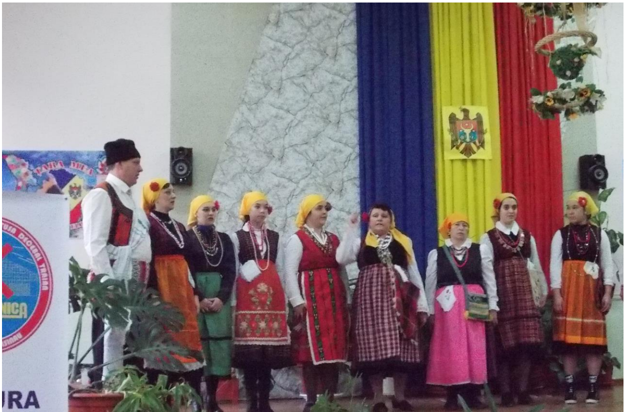
Участие във фестивала за войнишки фолклор «La Onor, la Datorie!» в Центъра «Младият натуралист» гр.Кишинев, район Ботаника.