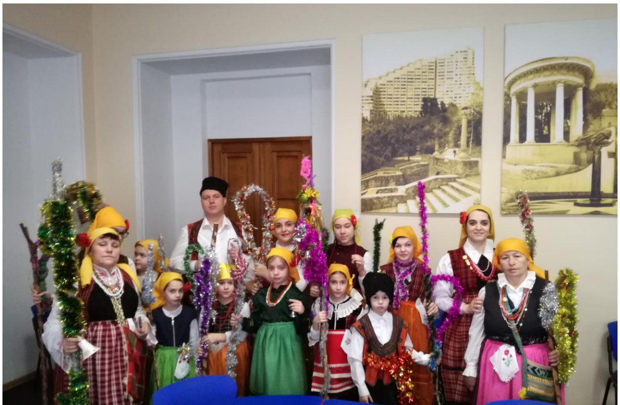
Етнофолклорен ансамбъл «Въгленче» коледува в Примърята на град Кишинев