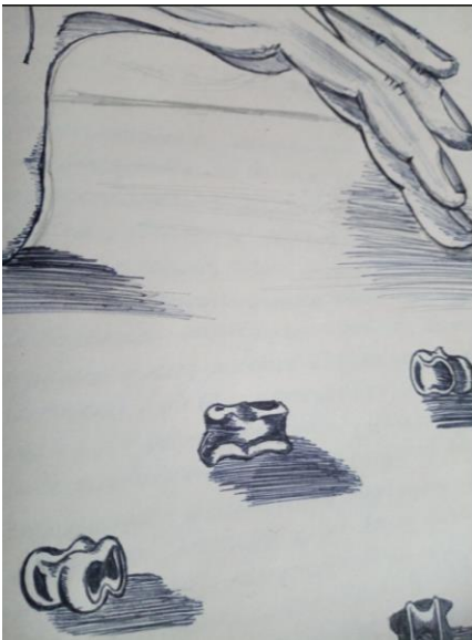
Рис. Анатолий Пагур